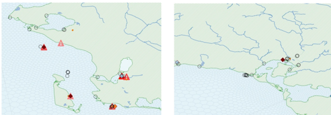
Figurtekst: Kortet viser projektets geografiske fokusområde med angivelser af forskellige punktkilder for forurening med miljøfarlige forurenende stoffer, med direkte (røde trekkanter) og indirekte (orange cirkler) udløb til fokusområdet og placeringer af prøvestationer (åbne cirkler). Forstørret udsnit vist for Storebælt/Fedkrogen (nederst til venstre) og Karrebæk Fjord (Nederst til højre)

Hele området er i dag klassificeret som værende i "dårlig kemisk tilstand." Ifølge den seneste vandområdeplan (VMP3.II 2021–2027) og Danmarks rapportering til EU under Vandrammedirektivet, skyldes den dårlige kemiske tilstand især overskridelser af grænseværdier for tungmetaller som bly, kviksølv og cadmium.